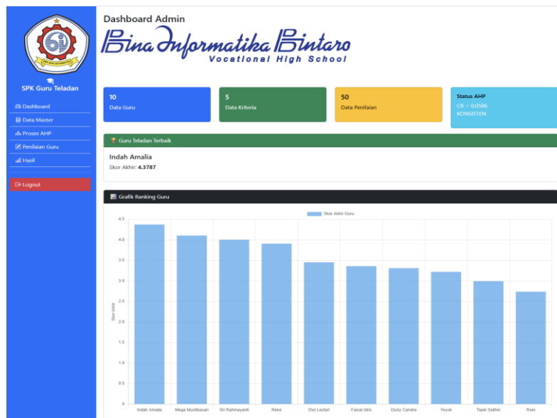
Gambar 2. Dashboard dan perbandingan berpasangan

Antarmuka utama sistem SPK pemilihan guru teladan di SMK Bina Informatika Bintaro yang memuat informasi jumlah data guru, kriteria, dan penilaian, serta grafik batang peringkat akhir guru berdasarkan skor untuk memudahkan perbandingan kinerja lihat pada Gambar 2.