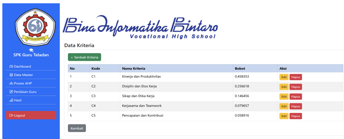
Gambar 3. Data Kriteria